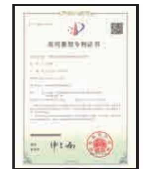
Patent for Utility Model