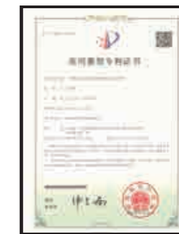
Patent for Utility Model