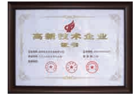
China High-Tech Enterprise