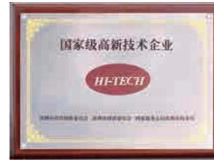
China High-Tech Enterprise

Melasta has a wide range of products from consumer batteries to industrial batteries. Medical equipment batteries are one of the core products of the company. Melasta produces standard replacement and customized battery packs by using brand cells such as Panasonic, Samsung and LG. Batteries have got the International certifications such as, UL, CB, KC, PSE, FCC, CE, UN38.3.