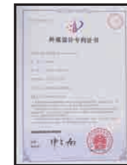
Appearance design paten